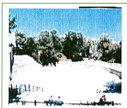
Arènes de Lutèce

Le Jardin des Plantes, héritier du Jardin Royal des plantes médicinales dont la création fut décidée en 1626 sous Louis XIII, vit le jour en 1635. Aujourd'hui, il dépend de l'Etat.